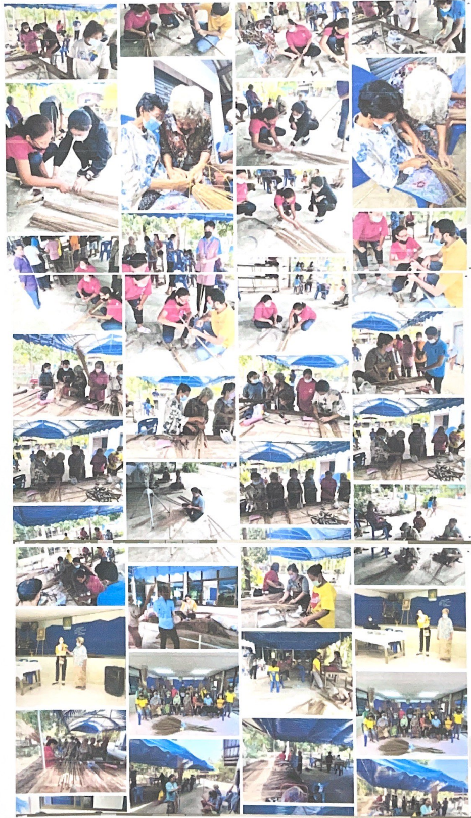
โครงการแก้ไขปัญหาคาความเดือดร้อนด้านอาชีพ ประจำปี 2565