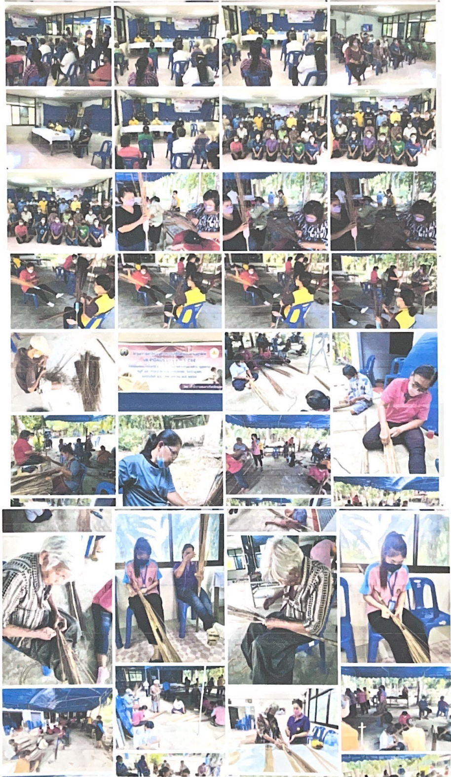
โครงการแก้ไขปัญหาคาแฉงรื้อนด้านอาชีพ ประจำปี 2565